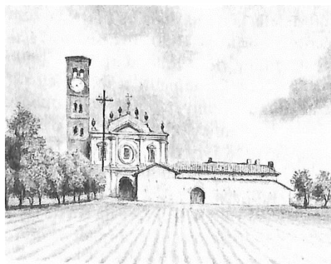
26 Chiesa di Testona, 1840