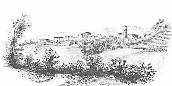
1 Revigliasco verso levante, 1832

Saluto dell'Assessore alla Cultura Città di Moncalieri