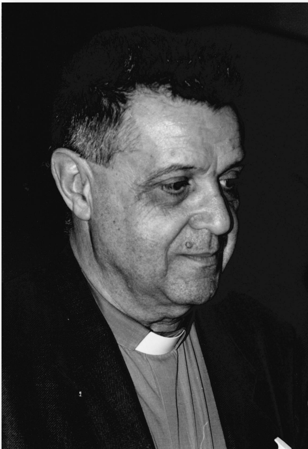
Giuliano Gasca Queirazza (Roma, 30 dicembre 1922 – Torino, 21 luglio 2009)