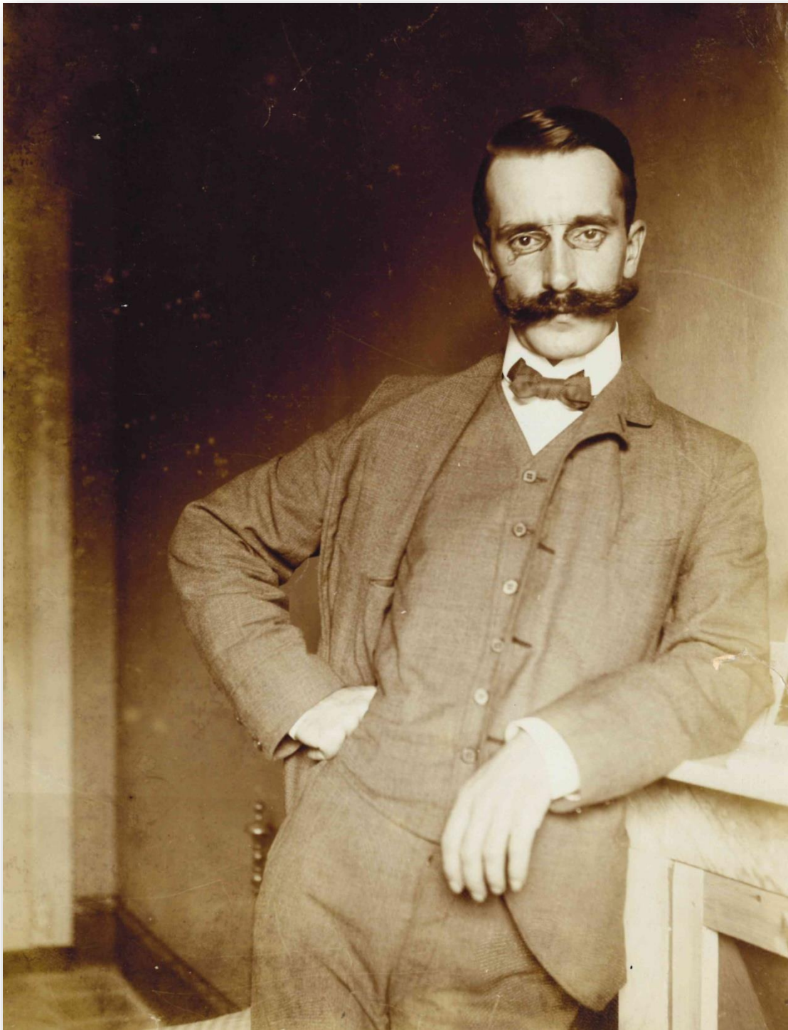
Enrico Thovez (Torino, 10 novembre 1869 – 16 febbraio 1925)